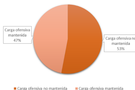
Figura 2. Porcentaje de carga ofensiva mantenida y omitida.

En cuanto a la eliminación de la carga ofensiva, que entendemos se refleja en las técnicas de neutralización y de omisión, obtenemos un total de 106 casos en las que esta no se ve reflejada, representados en porcentajes en la figura 2.